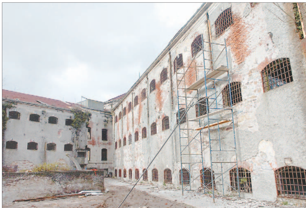
En obras. El Espacio de Arte Contemporáneo abrirá a fines de este año o principios de 2010.