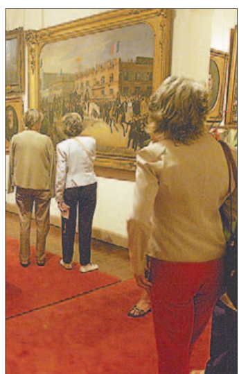
Museos: 20% hace difusión.

Mañana cierra la convocatoria Tu tesis en cultura de la Dirección Nacional de Cultura, la Universidad de la República y el Proyecto Editorial de la UTU. El objetivo es incentivar la producción académica sobre políticas culturales en Uruguay, mediante la publicación y difusión de los trabajos elaborados por estudiantes universitarios de instituciones públicas y privadas.