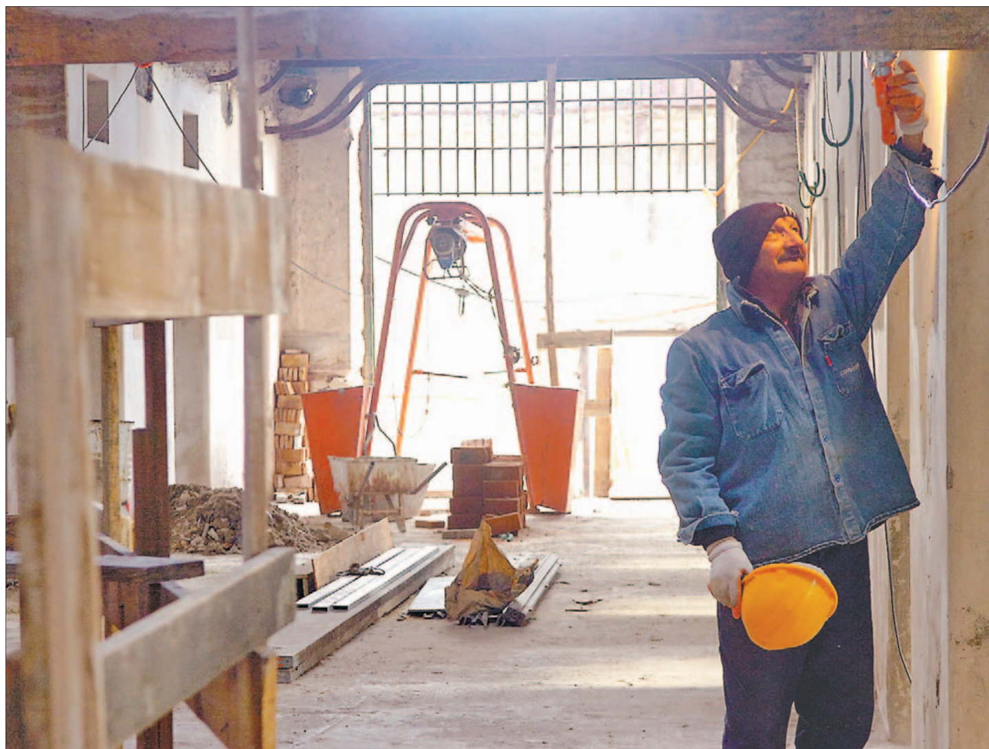
Entrada. En la planta baja estará el salón multiuso, cantina, boutique, mediateca, oficinas y varias salas, además de baños.

El herrumbre de las viejas puertas y plataformas, las paredes con humedades y grafitis, y las palomas que revolotean dueñas de las tres alas sin uso, serán el paisaje de fondo del EAC: del suelo de planta baja al techo levantarán un vidrio fijo